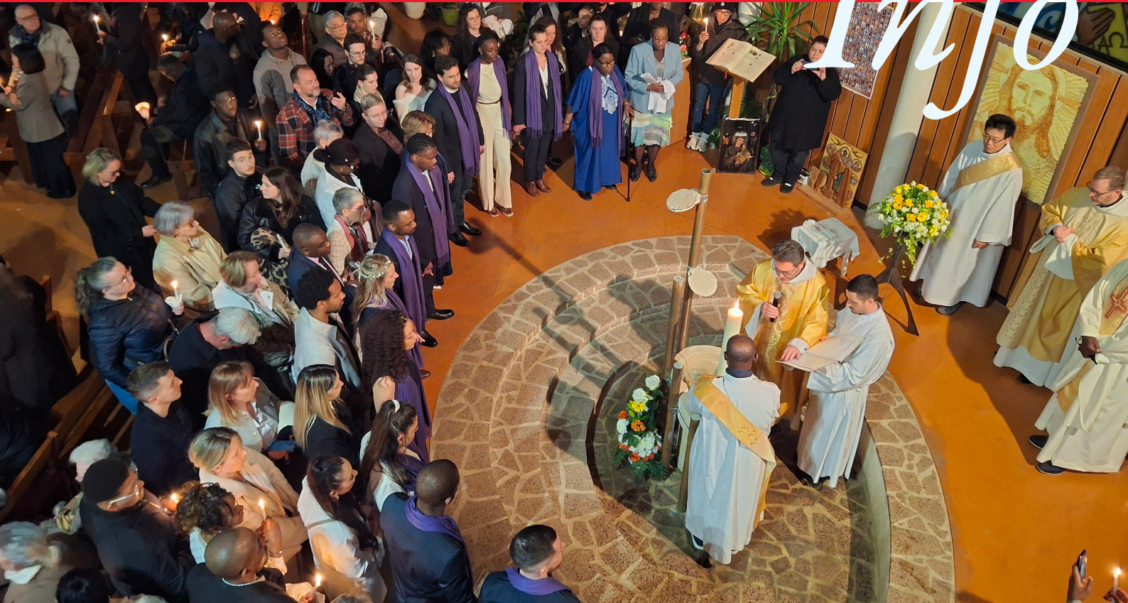
Notre-Dame du Val - vigile pascale 2026