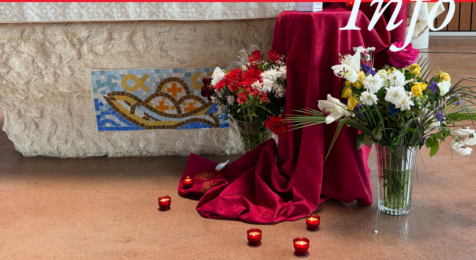
Notre-Dame du Val - Pentecôte 2026 - les dons de l'Esprit Saint